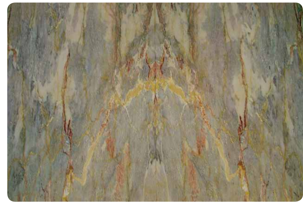
Ήλις • Helis