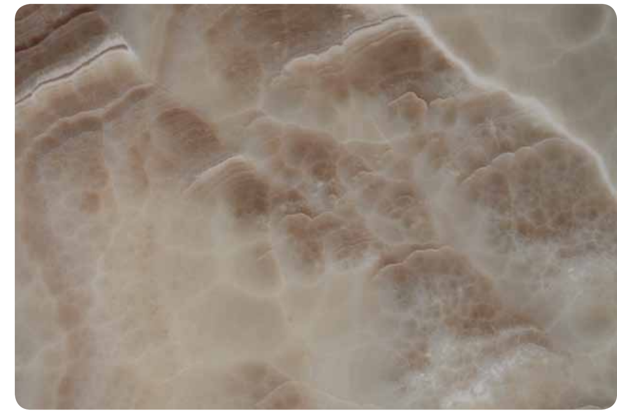
Όνυχας • Onyx